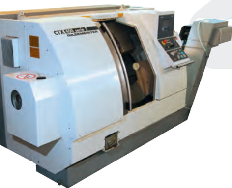
▲ Schrägbett-drehmaschine GILDEMEISTER CTX 400 Serie 2

Wir fertigen mit modernen Geräten und Maschinen – schnell und effizient – hochwertige Qualitätsprodukte.