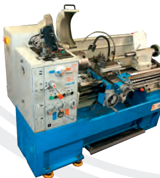
▲ Konventionelle Hochpräzisions-Drehmaschine V-Turn 410 Serie