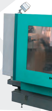
▲ Fräsmaschine Deckel Maho DMU 50 T